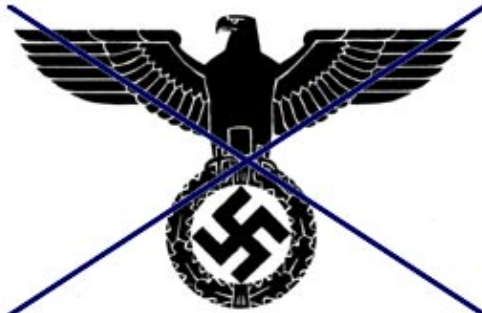
Muster für Druckausführung