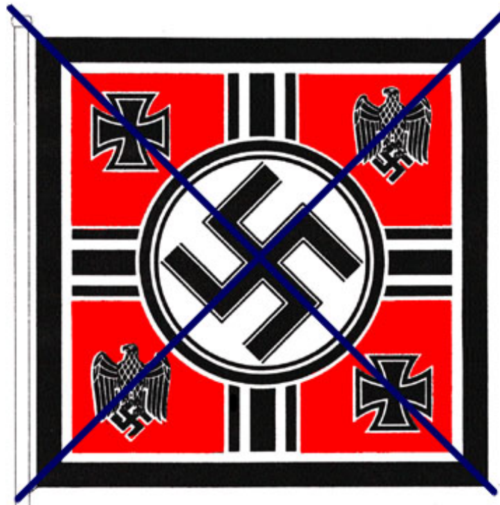
Flagge des Reichskriegsministers und Oberbefehlshabers der Wehrmacht